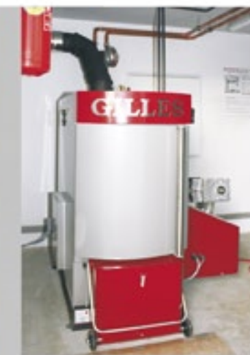
Caldaia a pellet HPK-RA 12,5-160