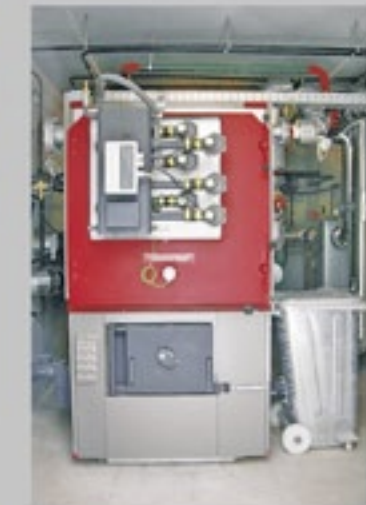
Caldaia industriale HPKI-K 120-900